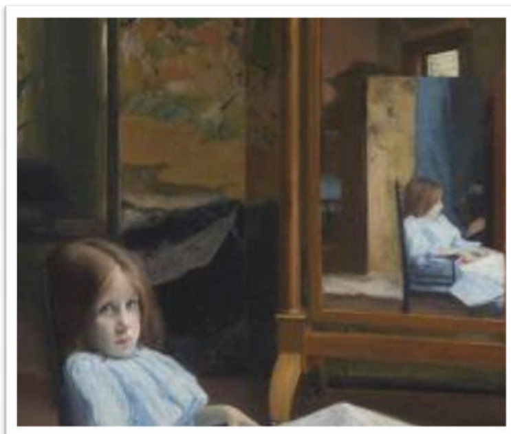
Jeune fille devant la psyché, J.-E. Blanche, 1889

Spectacle pour enfants à partir de 8/10 ans