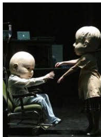
Ma chambre froide

« Pour toucher à la réalité humaine il ne faut pas choisir entre le dedans et le dehors mais admettre l'entremêlement des deux. Si tu te coupes de l'un des deux côtés, tu racontes une demi-réalité, une facette, une tranche. Pourquoi pas ? Mais, en ce qui me concerne, j'ai envie de capter le cœur entier des choses. C'est pour cette raison que mon théâtre cherche à travailler sur le gros plan. Plus que du grossissement, qui pourrait évoquer un effet de caricature, je cherche à obtenir une ultra-sensibilité. Comme une perception accrue, une hyper-lucidité qui fait percevoir, entendre, ressentir un détail de la façon la plus aiguë. (...) Notre relation à la chose observée redevient comme neuve et s'apparente à une découverte. Nous redécouvrons. Nous passons du familier à un ressenti extrême et nous voyons enfin la chose dans ce qu'elle est, ses moindres détails, ses paradoxes aussi. » (op. cit. p. 48)