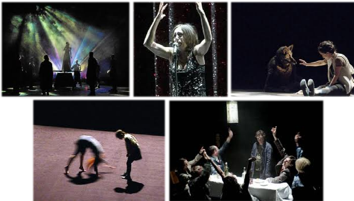
Quelques spectacles créés par Joël Pommerat