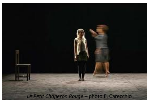
Le Petit Chaperon Rouge

En contrepoint de ses créations pour adultes, Joël Pommerat s'investit régulièrement dans une démarche dédiée à 100 pc aux enfants. Après Le petit Chaperon Rouge en 2006 et Pinocchio en 2008, il revient